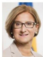
Johanna Mikl-Leitner Landeshauptfrau

Tauschen Sie Ihren alten Öl-/Gaskessel und sichern Sie sich bis zu € 10.500,- an Förderungen. Setzen Sie auf erneuerbare Energie, sparen Sie viel Geld und schützen wir unsere Umwelt.