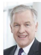
Martin Eichinger Landesrat

„Die Zukunft liegt in erneuerbarer Energie, die aus der Nähe kommt. Erneuerbar, regional und unabhängig.“