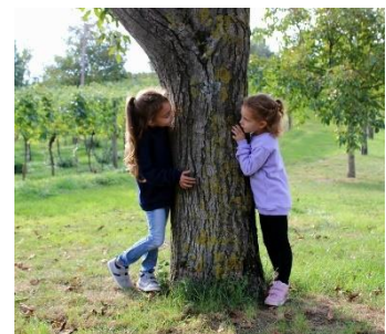
Symbolfoto: Herbst 2023

Viel Spaß bei der „Jagd“ nach den schönsten Fotos! ☺